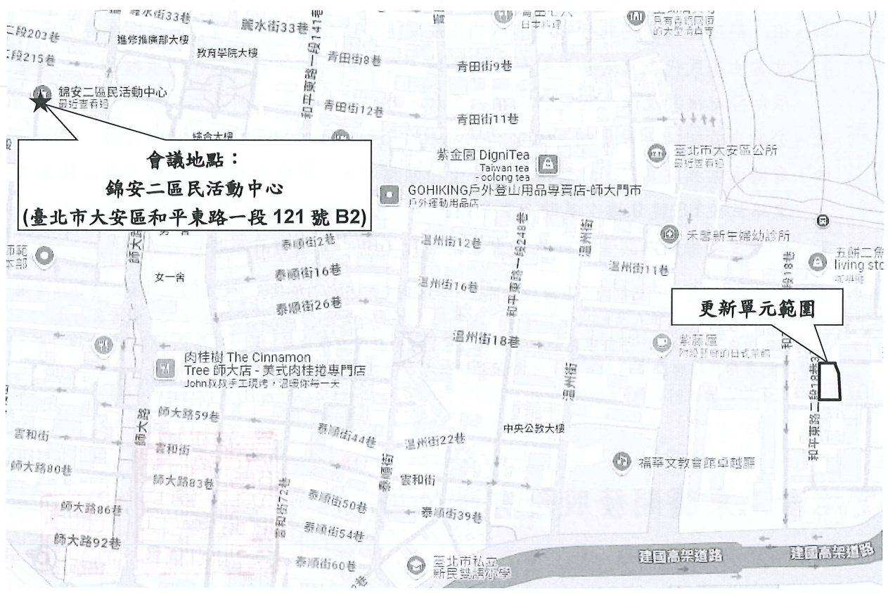
圖 2 開會地點位置示意圖